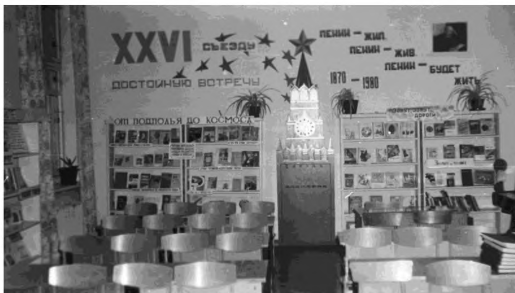
Оформление детского читального зала (1981 г.)

До конца восьмидесятых библиотека продолжала работу по коммунистическому воспитанию подрастающего поколения.