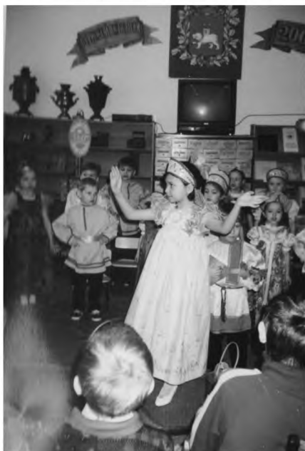
Выступление воспитанников детского сада № 29 на открытии Недели детской книги

В 1997 году широко отмечалось 200-летие Пермской губернии. Вся Неделя детской книги была посвящена этому событию. Часть читального