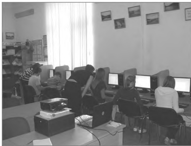
Автоматизированные рабочие места пользователей