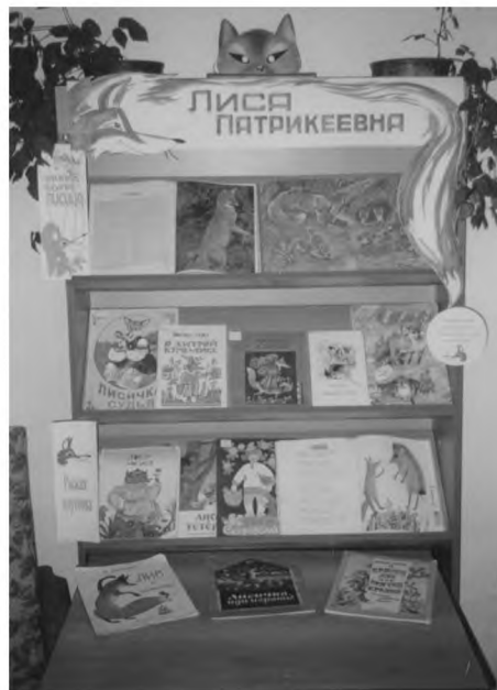
Выставки «Они живут рядом с нами» и «Лиса Патрикеевна», оформленные в библиотеке в рамках экологического проекта