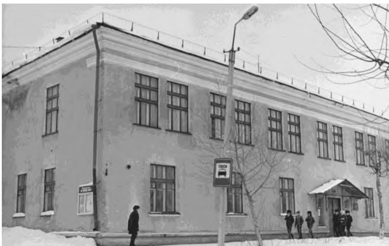
Новое здание городской библиотеки

В 1961 году городская библиотека переехала в новое двухэтажное здание в центре города по адресу Коммунаров, 20. На первом этаже разместилась детская библиотека. В связи с переездом произошла переинвентаризация фонда, его объем на начало 1962 года составлял 25910 экземпляров. В штате числилось 2 человека. С