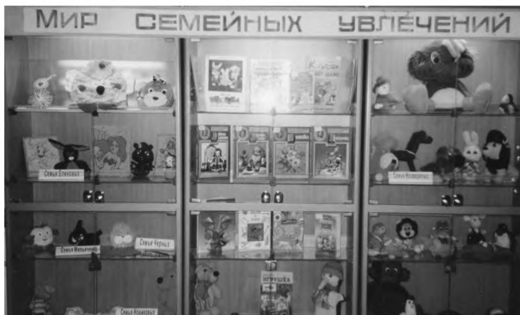
Выставка увлечений читающих семей