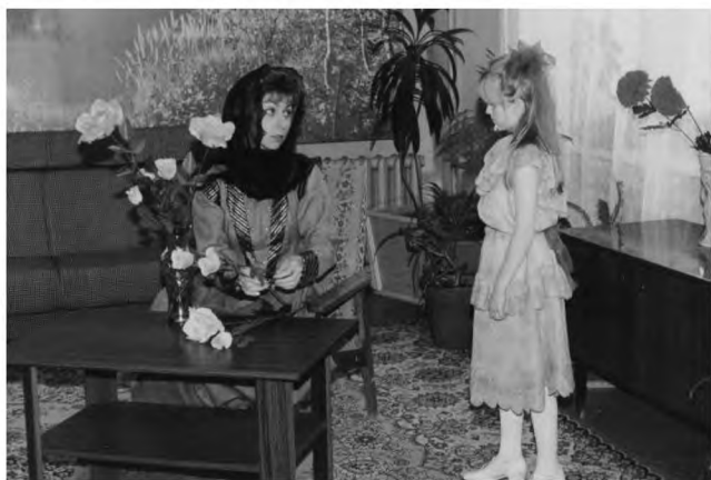
Фрагмент спектакля «Из жизни дворянских семей»