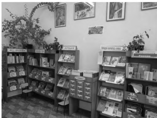
Новые стеллажи на абонементе

улучшить материальную базу всех муниципальных библиотек. В 2009 году для ЦДБ было приобретено 10 новых компьютеров, новая мебель (столы, стулья, кафедры), современные стеллажи, в том числе металлические для книгохранилища. Всего на детскую библиотеку было израсходовано 1 миллион 182 тысячи рублей. Библиотека полностью преобразилась. Все рабочие места библиотекарей были оснащены ПЭВМ, объединенными в локальную сеть. В читальном зале для детей оборудовано пять автоматизированных рабочих мест, оснащенных справочно-поисковой системой «КонсультантПлюс». Библиотека была подключена к интернету.