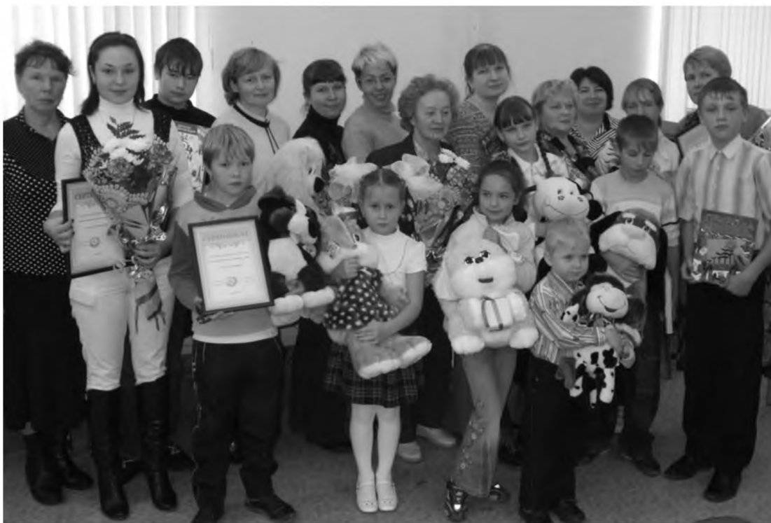
Призеры районного конкурса «Лучшая читающая семья 2009»

В 2012 году библиотека вновь провела анкетирование читательской группы родителей с детьми, которое показало, что наряду с книгой существенное место в развитии ребенка занял интернет возможностью просмотра фильмов и мультфильмов, познавательными компьютерными играми и только потом информацией о книгах и возможностью почитать новинки. Но часть родителей выразила готовность контактировать с библиотекой посредством интернет - получать информацию о книжных новинках, рекомендации книг для чтения ребенку, ссылки на электронные библиотеки. И эта работа уже началась. В 2012 году читатели детской библиотеки, в том числе родители, получили возможность оперативного доступа к информации ЦДБ на страничке библиотеки в социальной сети «Вконтакте» и на сайте Лысьвенской библиотечной системы.